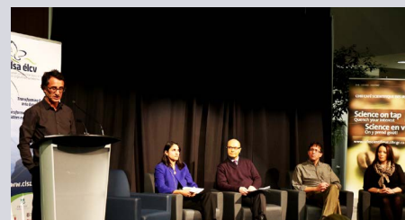
Café scientifique de Hamilton