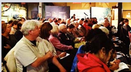
Café scientifique de Halifax

Dans la dernière année, l'ÉLCV a tenu deux Cafés scientifiques où le public était invité à participer à une discussion sur le vieillissement en santé. Les enregistrements de ces événements sont disponibles, en anglais, sur la chaîne YouTube de l'ÉLCV .